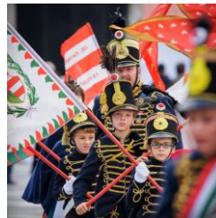
I. Gyermekehuszár Bandérium Fonyód