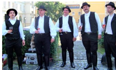
Vadkanok Nemzeti Dalárda