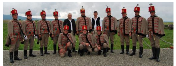
Kápolnásfalvi 15. Mátyáshuszárok