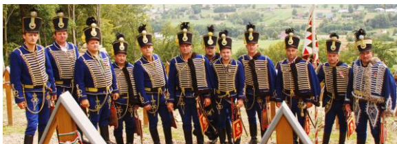
Szentegyházi Hagyományőrző Huszár Egyesület