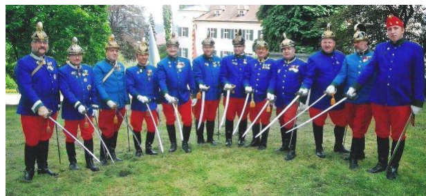
Bund ehem. 4er Dragoner (Ausztria) A Minősítő Bizottság tagjai