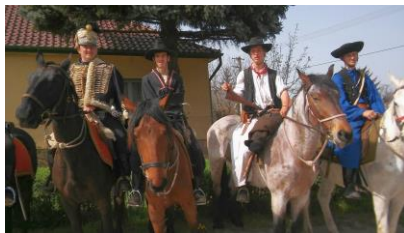
Tápiómenti Huszár és Betyár HE