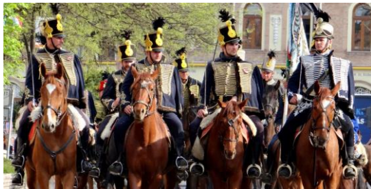
Jász Lovas Bandérium.

09.00 Újabb csapatok érkeznek (A képen látható csapatok csak illusztrációt képeznek.)