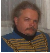
Györe József Gábor grafika