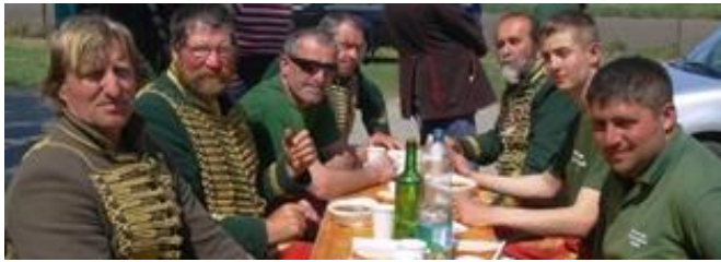
Felvidéki Huszár és Hagyományőrző Egy.