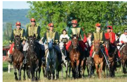
Gömöri Lovas és Népi H.Ő. Egy