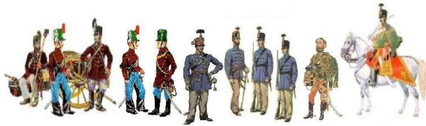
Váci Huszár és Nemzetőr Bandérium