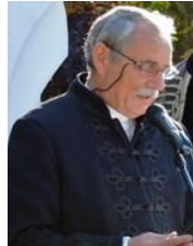
Lakos János polgármester