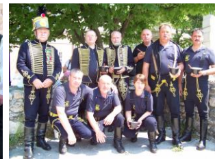
Somogyi Huszárok Egyesülete