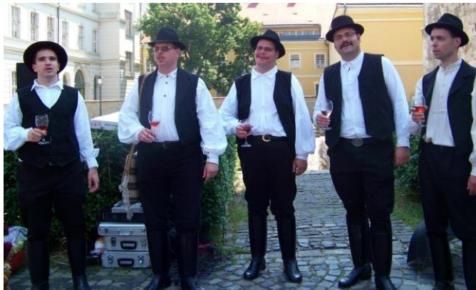
Vadkanok Nemzeti Dalárda